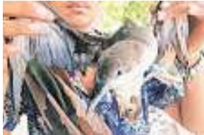
The rescued Persian shearwater.